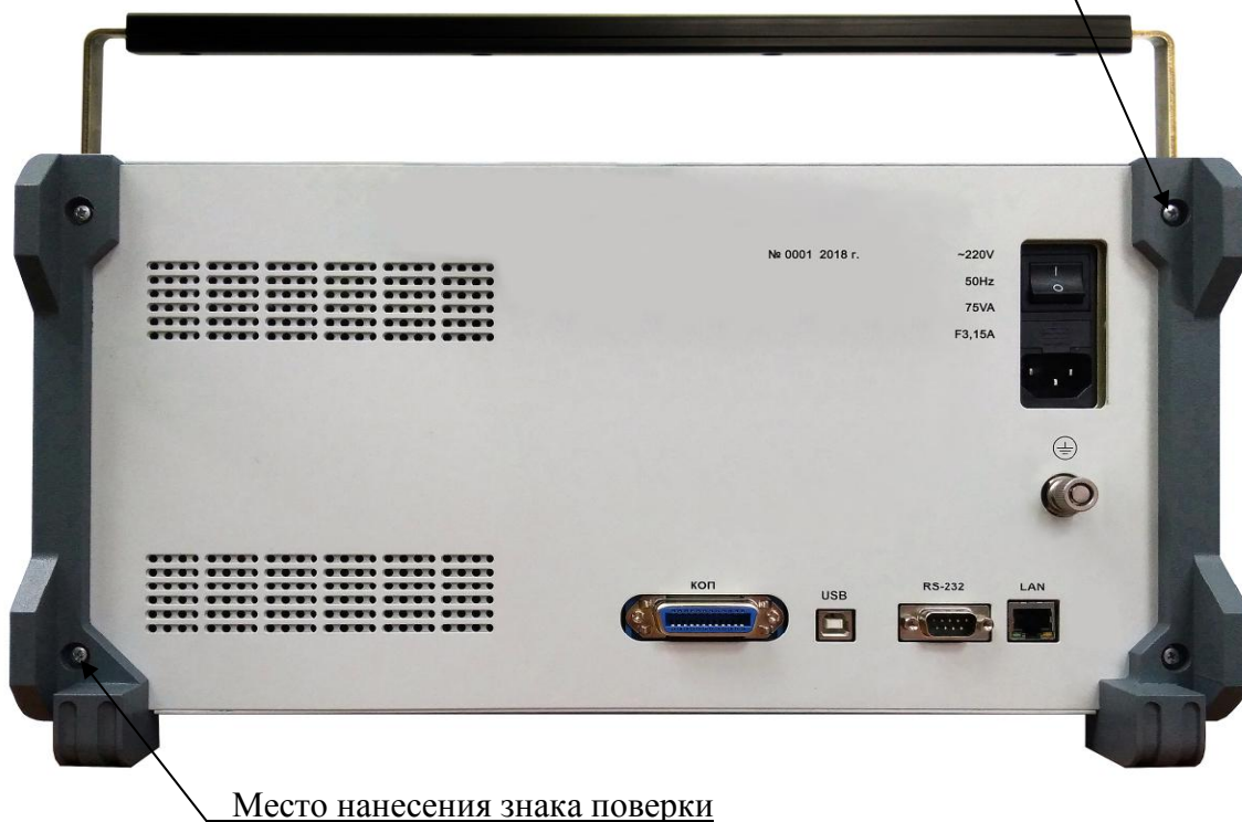
Рисунок 2 - Схема пломбировки от несанкционированного доступа, обозначение мест нанесения знака поверки